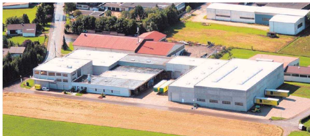
In Westerheim fertigt die Firma Meffle Kunststoffteile, die sich in fast jedem Kühlschrank finden.

Neben den Designteilen ist der Guss von Mehrkomponenten eine große Sparte bei Meffle. Bei der Herstellung von Haushaltsgeräten, bei der Spielwarenherstellung und in der Automobilindustrie sowie der Sanitärindustrie sind die Teile aus Westerheim, bestehend aus mehreren Werkstoffen, gefragt. Die Kunststoffteile werden dazu an den Mon-